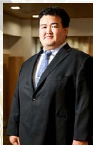
秀ノ山和弘(元大関琴奨菊)

歴史 二〇二〇年(令和二年)十一月場所中に現役を引退した元大関・琴奨菊は、年寄・十四代秀ノ山を襲名して佐渡ヶ嶽部屋付きとして後進の指導に当たったが、二〇二四年九月二十六日に開かれた日本相撲協会の理事会で、同年十月十九日付で力士四人を連れて独立し秀ノ山部屋を新設、「秀ノ山部屋」の名称は百十年ぶりに復活。 同年十一月に部屋の建物が完成。 秀ノ山部屋は、一九一四年以来百十年ぶりに再興力士の育成においては、「忍耐」「集中」「継続」を理念に掲げ、心身ともに強い力士を育てることを目標とされています。相撲道の精神を伝え、次世代へと繋げ、「心は無限」をモットーに。